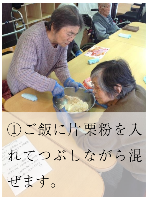
①ご飯に片栗粉を入れてつぶしながら混ぜます。