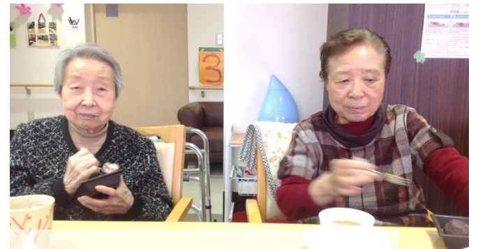
甘くておいしいよー♪