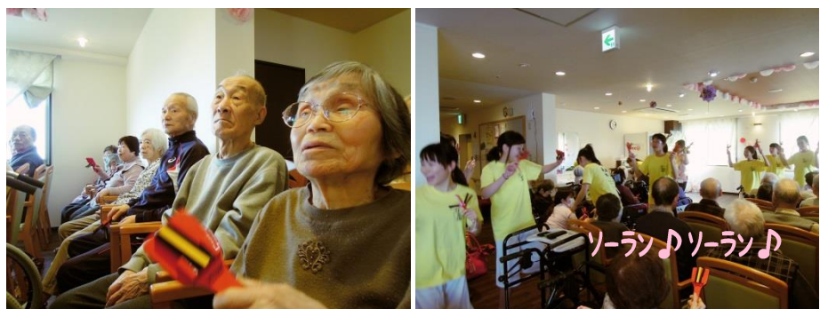
鳴子を持って一緒に踊りました！！！！