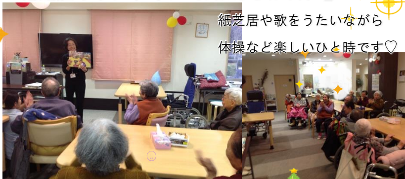
紙芝居や歌をうたいながら 体操など楽しいひと時です♡