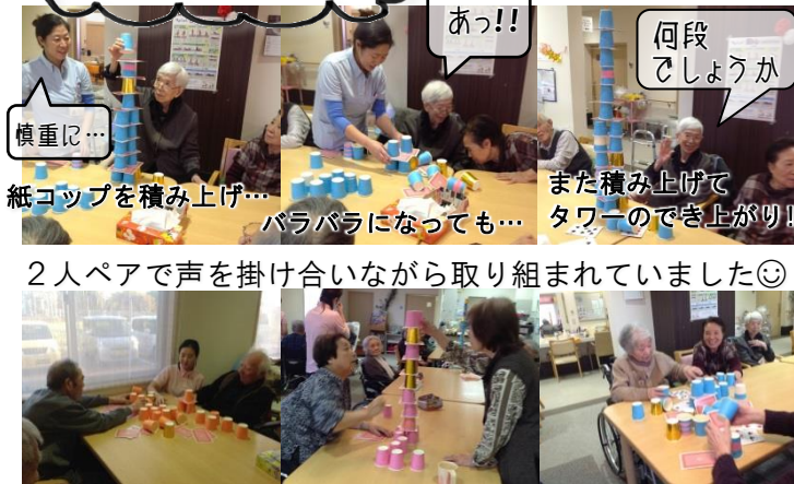
紙コップを積み上げ...