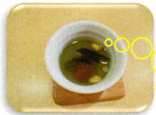
鬼退治の後、皆さんに福が訪れますようにという願いを込めた“福茶”をふるまいました。昆布、梅干し、煎り大豆に緑茶を注いだものです。

施設内の見学・体験入居のお申込み、介護サービス内容などはお気軽にお問い合わせ下さいませ。