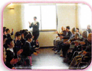
おじいちゃん、おばあちゃん 一緒に歌いましょう!