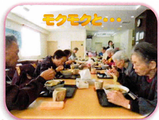
モクモクと・・・

1月下旬と2月下旬に、近所のラーメン屋さんより出前をとり、皆さんで召し上がっていただきました! 久々の方もおいでで、「おい～しかったア」と感想いただきました。 3月の予定は検討中です。