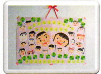
園児さん手作りの可愛らしい絵は4Fラウンジ入口に飾らせて頂きました♪

北陽保育園の園児さん33名による交流会が4Fラウンジにて行われ、歌やダンスの披露や、一緒に手遊びなどで楽しいひとときを過ごしました♪可愛らしい園児さんに感動し、涙を流される方もいらっしゃいました。最後に園児のみなさんより手作りの絵をいただきました。